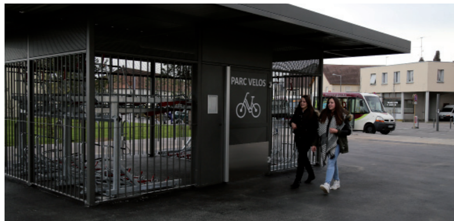
L'abri à vélos est prêt à accueillir ses pensionnaires.

Dans le but de promouvoir la pratique des modes de déplacements doux, le Grand Dole a installé un abri à vélos fermé sur le parvis de la gare de Dole.