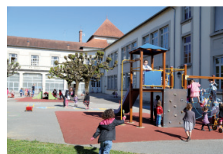
La ville de Dole procède actuellement à la rénovation du groupe scolaire Pointelin. Le Grand Dole financera la partie accueil de loisirs.

Un effort particulier sera fait en 2016 pour les accueils de loisirs du Grand Dole. Notamment sur ceux de Sampans, Tavaux et Crissey. Mais aussi et surtout du nouvel accueil de Pointelin (Dole), actuellement en cours d'aménagement par la ville de Dole. Ce nouvel accueil sera inauguré en septembre prochain.