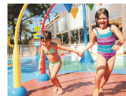
Un "aquasplash" à jets d'eau sera créé à la piscine de Tavaux