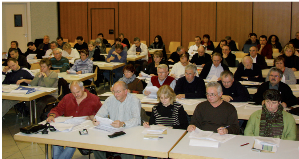
Réunis à Champvans le 17 décembre dernier, les délégués du Grand Dole ont voté à l'unanimité leur soutien au protocole d'accord Solvay-Dalkia-Grand Dole relatif à l'implantation d'une unité biomasse

Je terminerai, en vous souhaitant à tous de joyeuses fêtes de fin d'année et vous donne rendez-vous à l'année prochaine. Dès le 5 janvier, pour certains, et le samedi 17 pour vous tous, lors de la présentation des vœux communautaires.